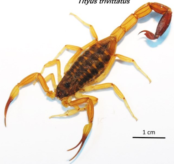
Figura 1: Escorpiones del género Tityus de potencial importancia médica en Paraguay. Tityus confluens (derecha, ejemplar hembra colectado en Lambaré, 15.ii.2019) y Tityus trivittatus (ejemplar hembra colectado en Barrio Jara, Asunción, 26.i.2019).

A pesar de que Paraguay comparte con países vecinos la presencia de especies de reconocida peligrosidad, no existe información en el país acerca de su potencial importancia médica, sobre la toxicidad del veneno de las poblaciones locales o el grado de neutralización de tal toxicidad por los antídotos antiescorpiónicos disponibles en el subcontinente. Existen reportes anecdóticos acerca de su supuesta baja toxicidad en el área urbana de Asunción (14), pero son necesarios estudios rigurosos que determinen la real