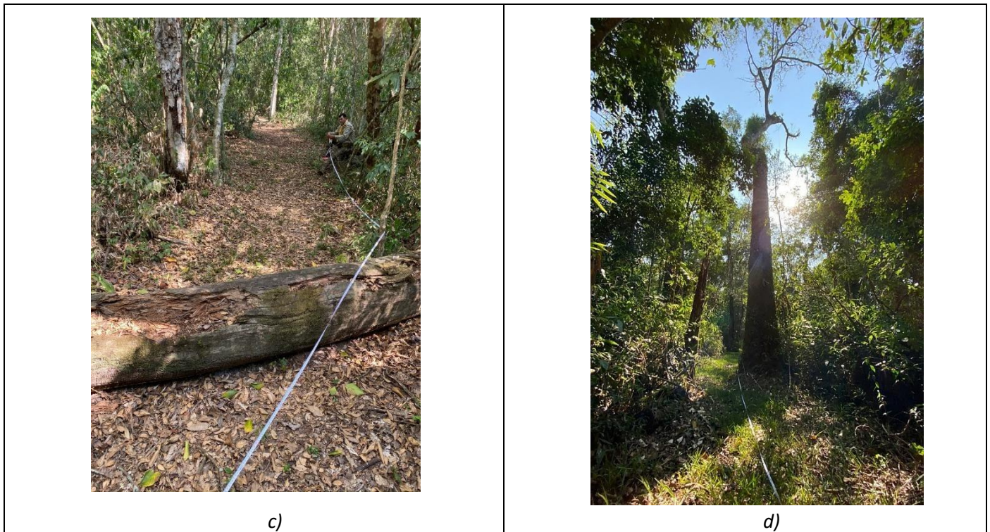
Figura 2: Protocolos de medición de CCT. Verificación y medición del ancho del sendero (a) sendero Aguara’i, (b) sendero Arroyo Morotí, (c) factor de corrección accesibilidad y verificación de la longitud total del sendero (d) factor de corrección brillo solar sendero Aguara’i. Fuente (7) .