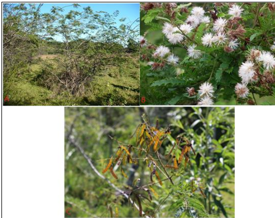
Figura 2. A-C. A. Hábito de la planta B. Panículas florales C. Frutos de color marrón claro que al madurar adquieren una pigmentación oscura

Material de Referencia: Departamento de Caaguazú, San Agustín, Distrito de Santa Rosa del Mbutuy. Arbusto espinoso en pastizal bajo natural. Coord. 24°29'53" S 56°20'52,5" O. R. Degen et H. Sarubbi 4825, FCQ.