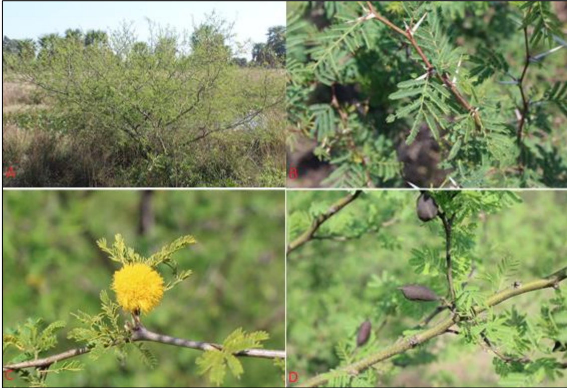
Figura 8. A-D. A. Hábito de la planta B. Detalle de morfología de las hojas compuestas C. Detalle de un glomérulo de flores amarillas D. Detalle de frutos maduros.

La presencia de estas especies pertenecientes a la subfamilia Mimosoidea en esta ecorregión se corresponde con los registros (19) . En cuanto a la producción pecuaria, Pott et al. (13) , destacan que las mimosas espinosas cuando forman rodales, hacen la transitabilidad muy difícil y los animales no entran al área, ni el personal a caballo. Esta situación es visible en varias áreas, donde el pasto queda fuera del alcance de los animales debido al desarrollo de estas arbustivas, que cuando adquieren un tamaño considerable, adoptan una morfología de sombrilla, muchas veces con un fuste casi inexistente y predominio de ramas; con poca altura y crecimiento horizontal, disminuyendo notablemente el área útil para la ganadería (8) (Figura 9). En ciertas áreas, como la zona de influencia del río Salado, plantas de Vachellia cavens y Mimosa pigra cubren totalmente el terreno, desplazando al estrato herbáceo.