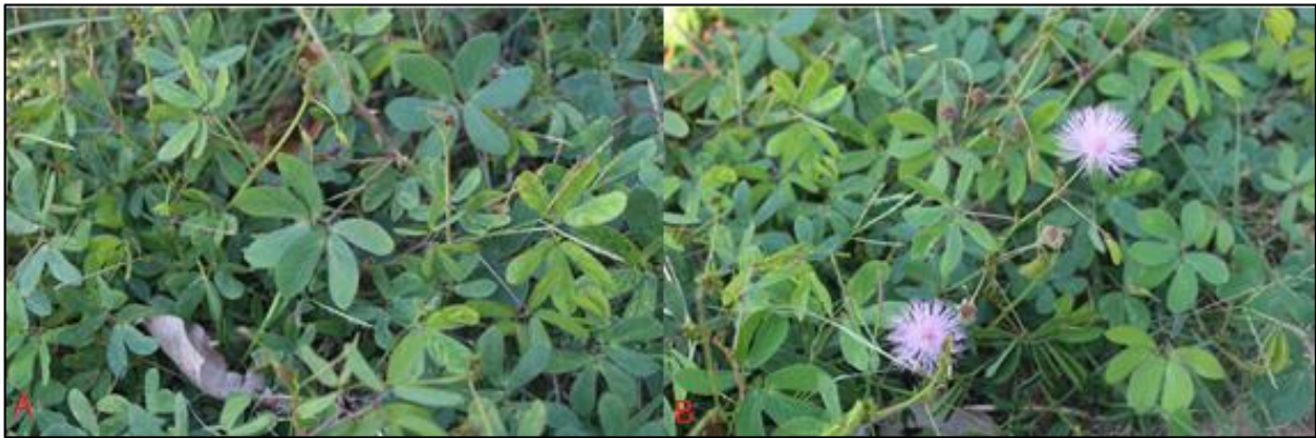
Figura 3. A-B. A. Hojas bipinnadas obovadas a obovadas-lanceoladas B. Inflorescencias rosadas liláceas.

Material de Referencia: Departamento Central, Ruta Luque-San Bernardino. Coord. 25°12'07.7"S 57°21'34.8"O. R. Degen et H. Sarubbi 4829.