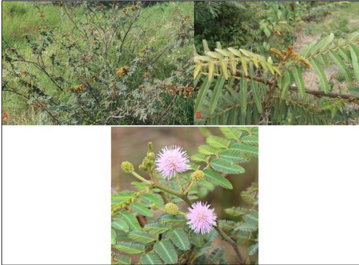
Figura 4. A-C. A. Hábito de la planta B. Detalle del crecimiento y morfología de las hojas compuestas C. Detalle de flores esféricas rosadas

esta investigación, que esta especie crece especialmente en regiones de terrenos bajos asociados a poáceas y es la principal mimosoidea de esta ecoregión.