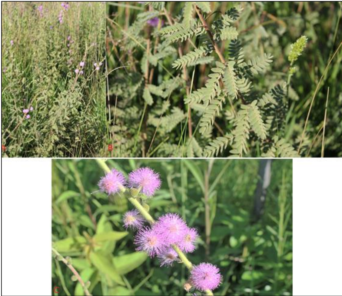
Figura 6. A-C. A. Hábito de la planta B. Detalle de hojas compuestas bipinnada C. Inflorescencia terminal con glomérulos rosados.