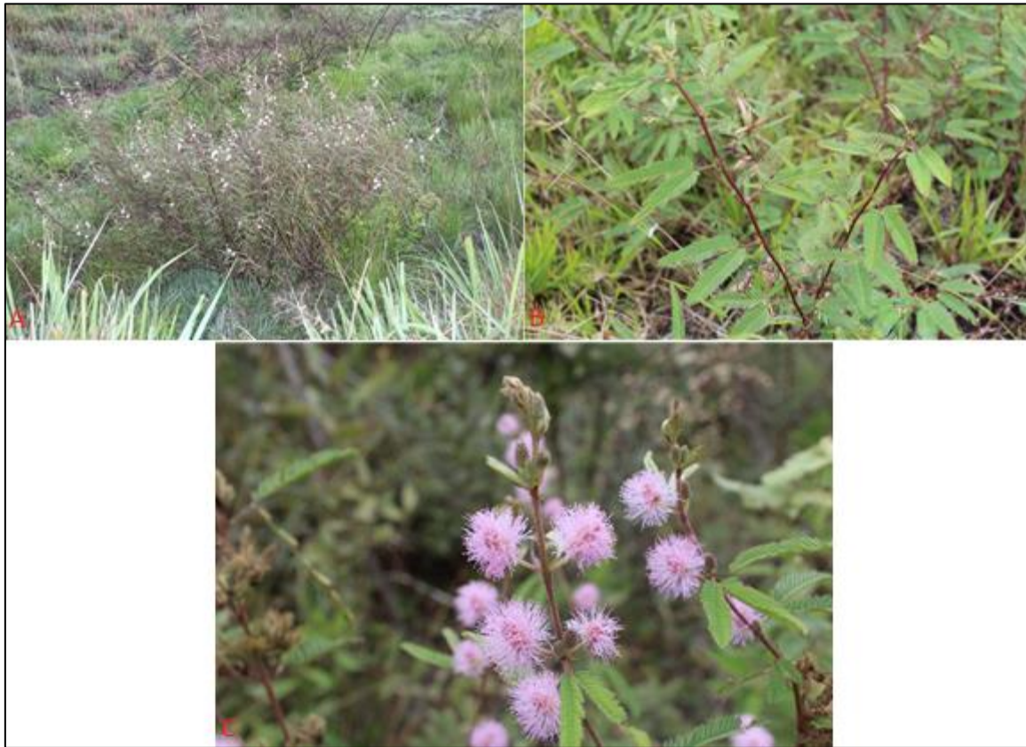
Figura 5. A-C. A. Hábito de la planta B. Ramas rojizas con hojas compuestas bipinnadas C. Detalle de inflorescencia esférica con flores rosadas.