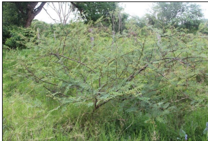
Figura 9. Planta de Mimosa pigra colonizando completamente el terreno.

La presencia de estas especies pertenecientes a la subfamilia Mimosoidea en esta ecorregión se corresponde con los registros (19) . En cuanto a la producción pecuaria, Pott et al. (13) , destacan que las mimosas espinosas cuando forman rodales, hacen la transitabilidad muy difícil y los animales no entran al área, ni el personal a caballo. Esta situación es visible en varias áreas, donde el pasto queda fuera del alcance de los animales debido al desarrollo de estas arbustivas, que cuando adquieren un tamaño considerable, adoptan una morfología de sombrilla, muchas veces con un fuste casi inexistente y predominio de ramas; con poca altura y crecimiento horizontal, disminuyendo notablemente el área útil para la ganadería (8) (Figura 9). En ciertas áreas, como la zona de influencia del río Salado, plantas de Vachellia cavens y Mimosa pigra cubren totalmente el terreno, desplazando al estrato herbáceo.