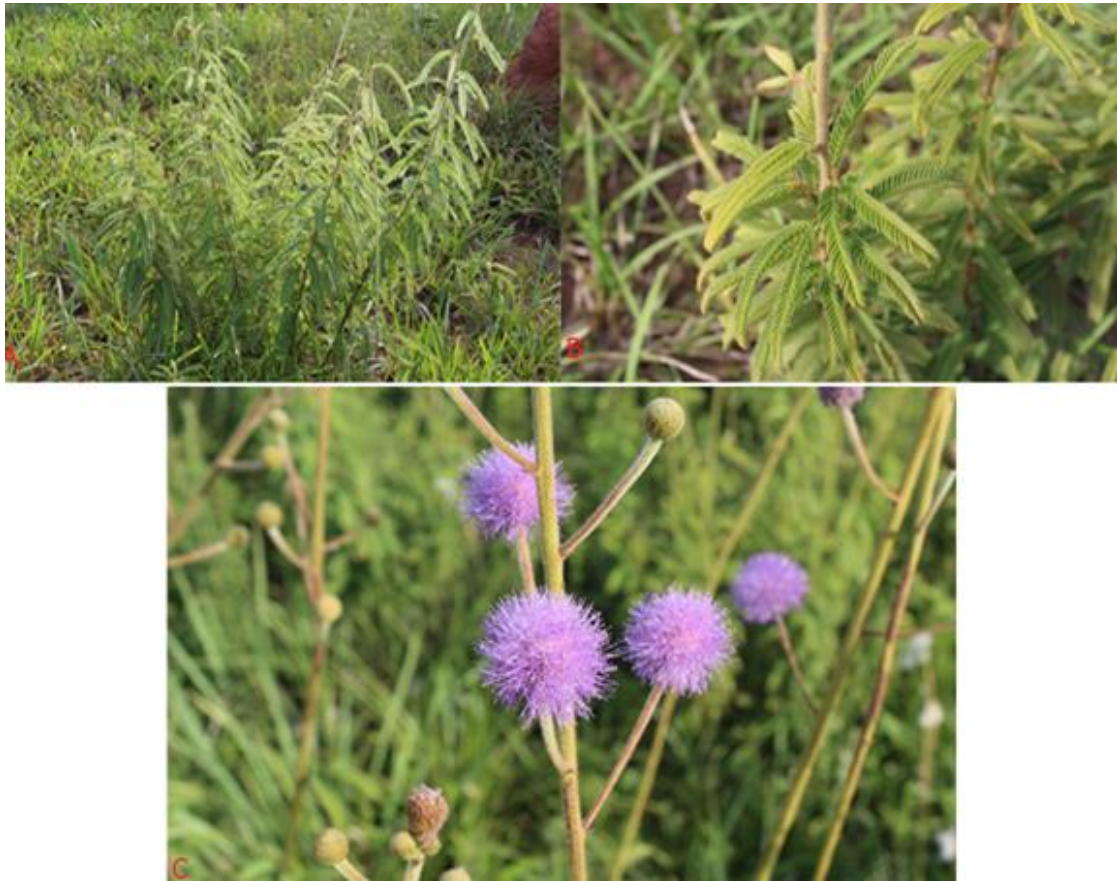
Figura 7. A-C. A. Hábito de la planta B. Detalle de hojas compuestas bipinnadas C. Inflorescencia terminal con glomérulos rosado-liláceos.